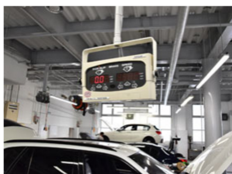
最新設備で効率アップとミス撲滅