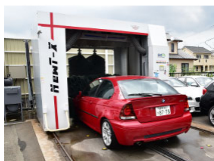
機械化や外部スタッフの有効活用

ただ闇雲に“残業を減らせ”では、お客様と現場のスタッフに負担がかかってしまいます。静岡BMWでは、最新の設備を導入し効率よく迅速にサービスをご提供できる体制を整えています。また、専門知識のあるスタッフを適所に配置し、スタッフそれぞれが持っているBMWの知識を有効活用し、お客様に対し最大級のおもてなしを行うことを心がけています。