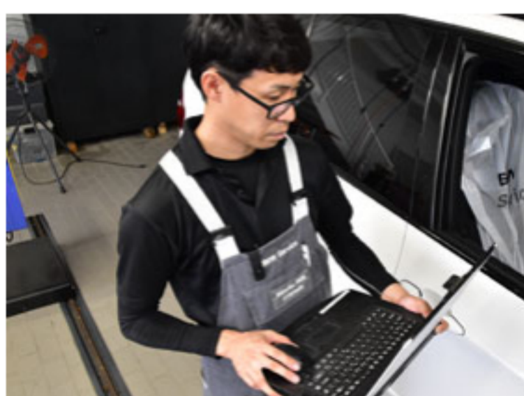
ツールの活用で迅速な診断