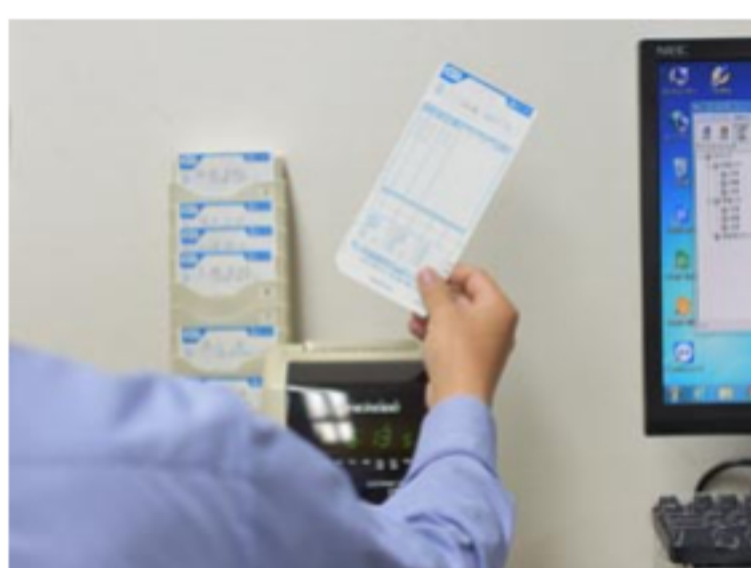
残業時間目標の設定