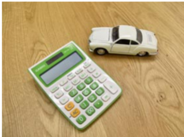
クレジット金利の優遇