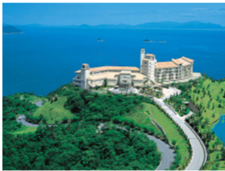
グランドエクシブ鳴門