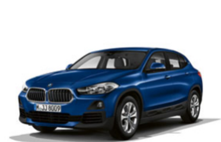
新車中古車購入時の割引

静岡BMWの社員は社員割引購入制度が利用できます。なんとこの社員割引は2親等の家族まで利用が可能です。2親等とは、本人または配偶者から数えて2世代のこと、つまり社員または配偶者の両親や祖父母、兄弟が社員割引で車を購入できます。