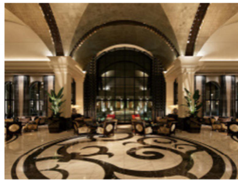
エクシブ有馬離宮