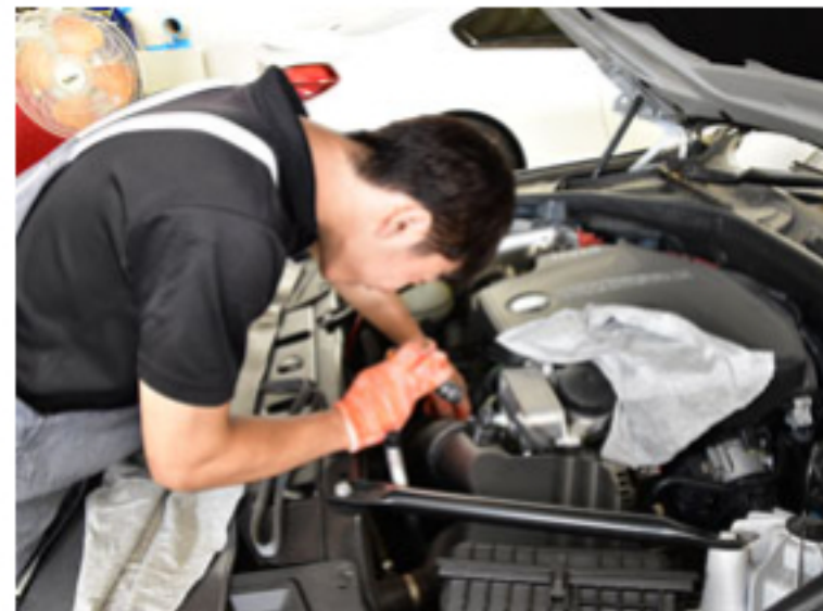
整備及び修理代の割引